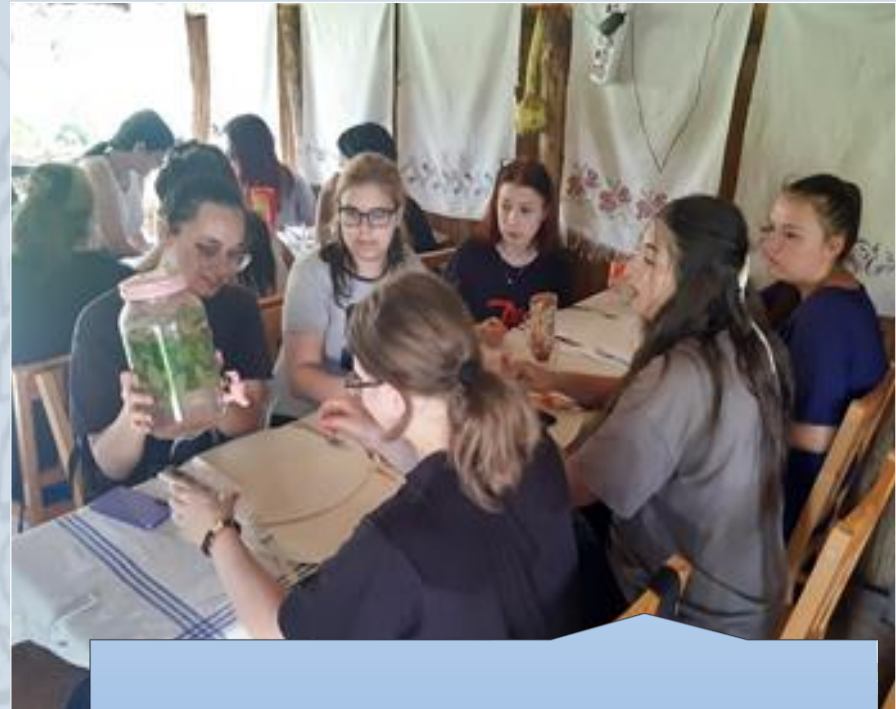
Baráth Vendégház, Tákos