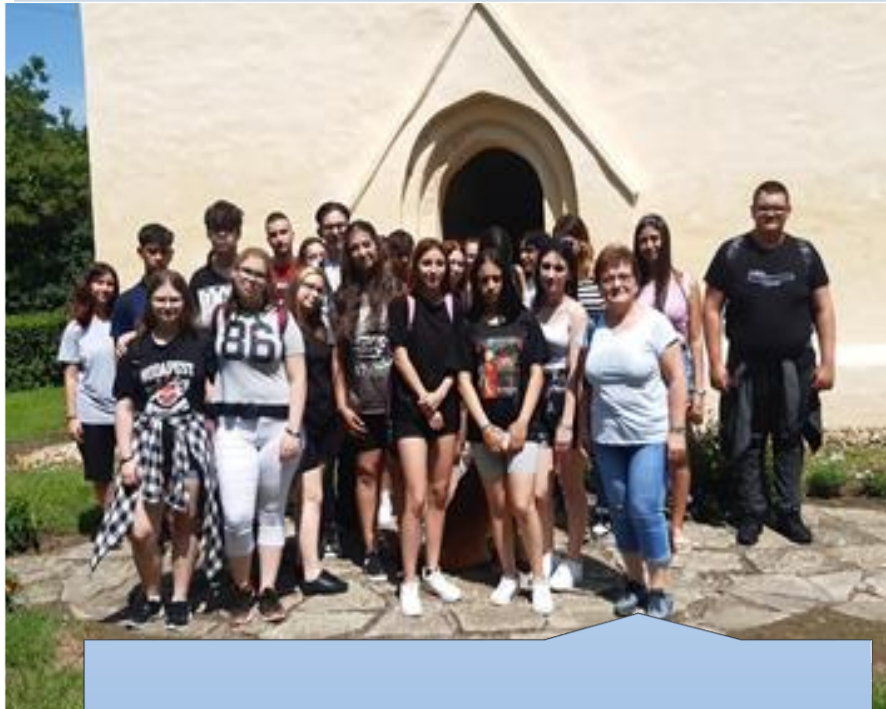
Csarodai református templom