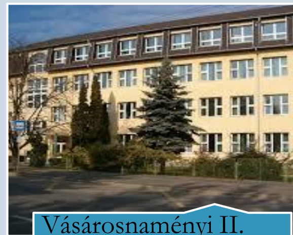
Vásárosnaményi II. Rákóczi Ferenc Gimnázium