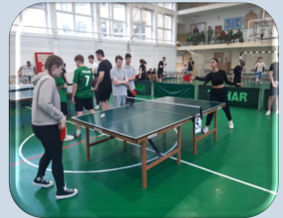
Asztalitenisz Verseny, Nyírszőlős