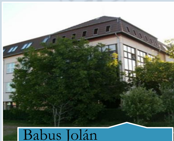
Babus Jolán Középiskolai Kollégium